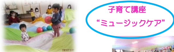
子育て講座 “ミュージックケア”