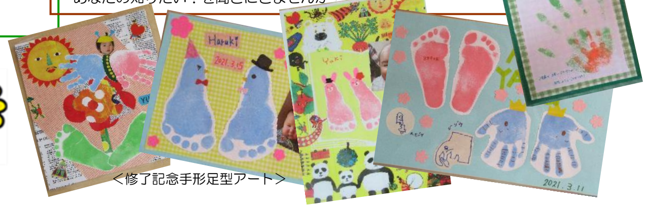
<修了記念手形足型アート>